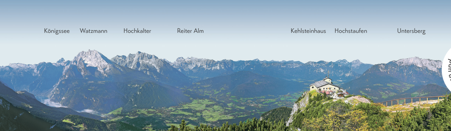
Panoramablick vom Kehlstein Panoramic view from the Kehlstein

Das Kehlsteinhaus liegt auf 1.834 Metern Höhe über Berchtesgaden. Seine Geschichte ist untrennbar mit der des Obersalzberg verbunden. Dort befand sich zwischen 1933 und 1945 das neben Berlin wichtigste Machtzentrum der nationalsozialistischen Diktatur, wo über Verfolgung, Krieg und Völkermord entschieden wurde.