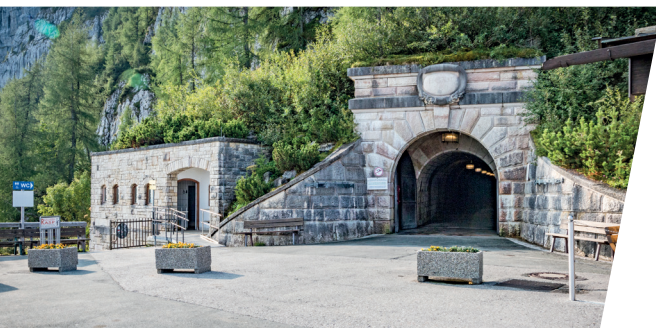
Ein beleuchteter Tunnel führt zum Aufzug im Berg. An illuminated tunnel leads to an elevator inside the mountain.

Tatsächlich blieb die Bedeutung des Hauses in der NS-Zeit gering. Hitler fuhr selten hinauf, um Diplomaten oder andere ausländische Gäste zu empfangen. Viel häufiger nutzte es die am Obersalzberg versammelte NS-Entourage zur Erholung und für private Feiern.