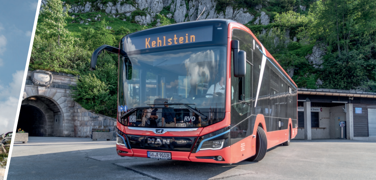
E-Bus auf der Buswendeplattform direkt unterhalb des Kehlsteinhauses Electric bus parked at the turn-around point directly below Eagle's nest.